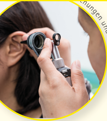
Einrichtungen und Hörtests